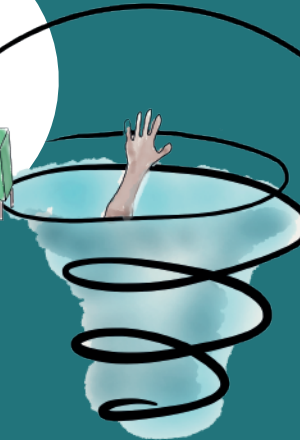
Verergering van symptomen Minder cognitieve flexibiliteit