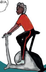
Thuis (online) sporten

Om de neerwaartse spiraal tegen te gaan en nieuwe thuisgebonden routines op te zetten, kunnen mensen met Parkinson wel een beetje hulp van hun vrienden (en artsen) gebruiken