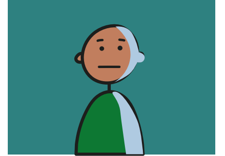
Duyguları göstermede zorluk