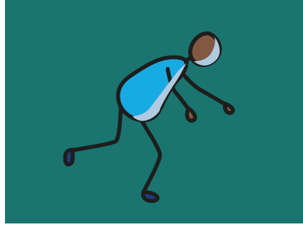
Düşmek ve donmak