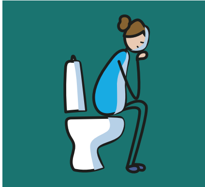
Tuvalete gitmekte zorluk