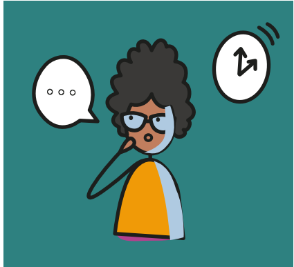
Birşey söylemek için daha fazla zamana ihtiyaç duymak.