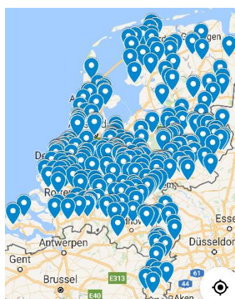
Verpleeghuizen in NL (ZorgkaartNederland, 2022)

Volgens Zorgkaart Nederland telt Nederland in 2022 in totaal 2358 verpleeghuizen, 54 daarvan heeft bij de Parkinson Vereniging aangegeven parkinsonexpertise in huis te hebben. Dat varieert van een diëtiste die aangesloten is bij ParkinsonNet, het organiseren van een Parkinson café, tot het hebben van een geclusterde parkinsonwoonafdeling. Uit het VIP2 project blijkt dat slechts in 10 van de 54 van deze verpleeghuizen mensen met parkinson op een gespecialiseerde parkinsonwoonafdeling geclusterd kunnen wonen. Dat komt neer op zo’n 200 woonplekken in Nederland.