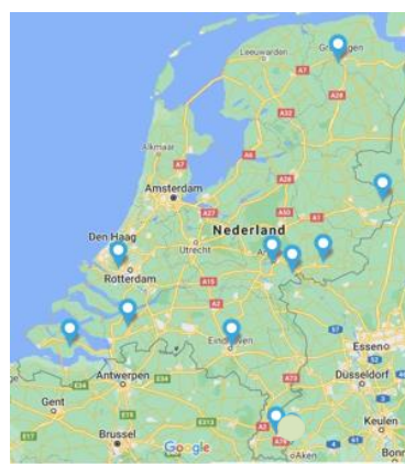
Verpleeghuizen met parkinsonwoonafdeling (VIP2, 2022)

Met grote regelmaat krijgt de Parkinson Vereniging vragen over parkinson in het verpleeghuis. Mantelzorgers maken zich zorgen over de kwaliteit van zorg, beschrijven de onervarenheid van zorgverleners met de ziekte en voelen zich ook nog tijdens de verpleeghuisopname verantwoordelijk voor het zorgproces. Die verantwoordelijkheid is voor veel mantelzorgers een te grote last omdat zij juist overbelast zijn geraakt toen degene voor wie ze zorgden nog thuis woonde. Medicatie wordt onjuist aangeboden (verkeerd tijdstip en/of met verkeerde voeding), er is onbegrip voor on- en off-fasen. Mensen met de ziekte van Parkinson wonen in het verpleeghuis vaak onterecht samen met mensen met dementie, de afdeling kan zorgen voor overprikkeling en de naden in de vloeren en de smalle doorgangen wekken freezing op. Dit is slechts een greep van de gehoorde klachten.