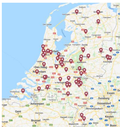
Verpleeghuizen met parkinsonexpertise (gemeld bij Parkinson Vereniging, 2022)